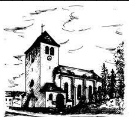
St. Antonius Einsiedler-Kirche Gerlingen

Am Freitag, den 09.01.2026 lädt der Gemischte Kirchenchor St. Hubertus Ottfingen zur Generalversammlung ein. Beginn ist um 18:00 Uhr in der alten Kapelle. Es stehen unter anderem Wahlen an.