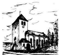
St. Antonius Einsiedler-Kirche Gerlingen

Im Anschluss an die vom Lourdesverein Westfalen e.V. mitgestaltete Messe am 08.02. besteht die Möglichkeit zum kleinen Imbiss im Pfarrheim. Musikalisch wird die Messe umrahmt vom Ensemble „Lourdes Brass“. Die Predigt hält Pfarrer Markus Leber, geistlicher Leiter des Lourdesvereins. Herzliche Einladung.