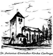
St. Antonius Einsiedler-Kirche Gerlingen