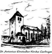
St. Antonius Einseleer-Kirche Gerlingen