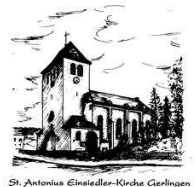
St. Antonius Einseleler-Kirche Gerlingen