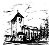
St. Antonius Christkönig-Kirche Gerlingen

An Fronleichnam feiern wir ab 15:00 Uhr rund um die Kunibertuskirche das Pfarrfest für die ganze Familie. Abwechslungsreiche Spielstände, Kaffee und Kuchen, Eis und Leckeres vom Grill werden geboten. Der Musikverein und die Tanzmäuse sorgen für beste Unterhaltung. Herzliche Einladung an alle.